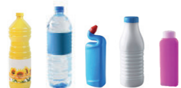
Emballages en plastique